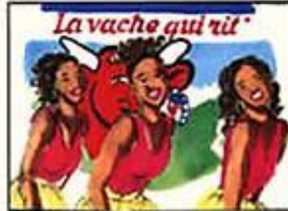
Chœur : "Parce que vache qui rit !"