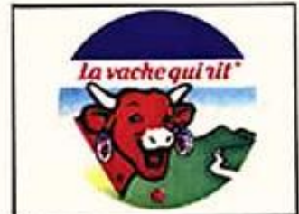
(SFX : Rire façon Salvador)