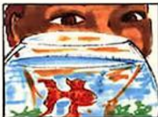
Enfant : "Pourquoi ils sont rouges les poissons rouges"