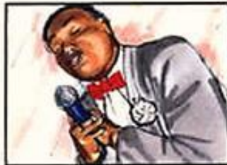
Crooner ringard : "Pourquoi m'as-tu quitté, pourquoi..."