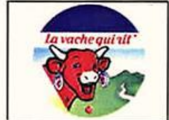
(SFX : Rire façon Salvador)