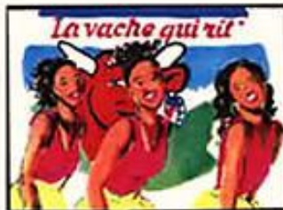
Chœur : "Parce que vache qui rit !"