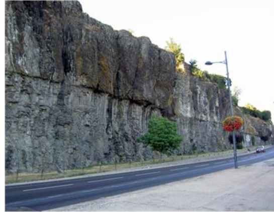
منظر عام لصخور البازلت

صخرة داكنة، صلبة خشنة كثيفة. تحتوي على بلورات كبيرة (الأوليفين والبيروكسن) وعلى عجين.