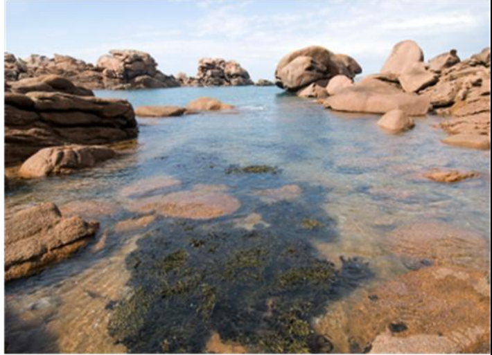
منظر لصخور الكرانيت.