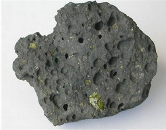
عينة من صخرة البازلت

1- ملاحظة عينات من صخرتي البازلت والكرانيت بالعين المجردة.